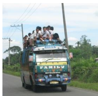
op weg naar Medan

Dag 6: Berastagi naar Bukit Lawang: Na het ontbijt volgt een korte rit per wagen vooraleer je naar de top van de Sibayak-vulkaan klimt: een boeiende tocht door tropische vegetatie en langs dampende zwavelbronnen . De tocht terug is een stevige wandeling. Na de trekking kan je heerlijk nagenieten in de warmwaterbaden te Raja Berneh , met een heilzame werking voor de huid. We rijden verder naar Bukit Lawang en maken een stop bij Anna Maria Velangkanne Katholieke kerk . Bukit Lawang ligt aan de rand van het Gunung Leuser National Park en gekend als rehabilitatiecentrum voor orang utans . Intrek in de schitterend gelegen Bukit Lawang ecolodge .