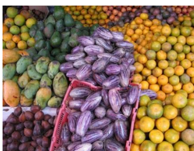
markt in Berastagi